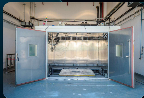
六自由度振动测试台