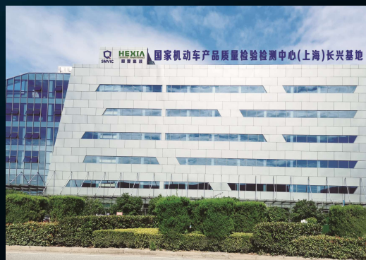
浙江长兴试验中心