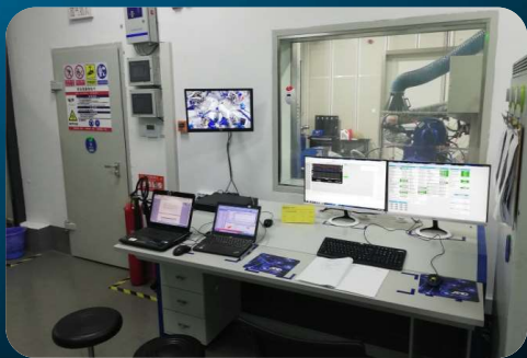
发动机实验室操作间