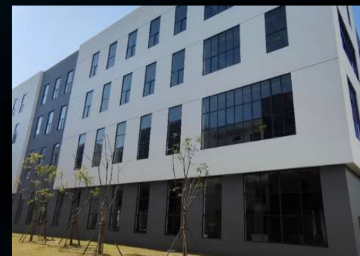
上海金山试验中心