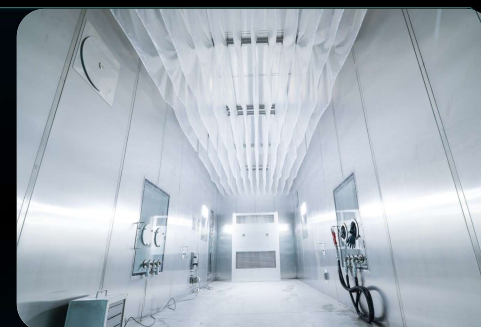
轻型车密闭蒸发试验舱